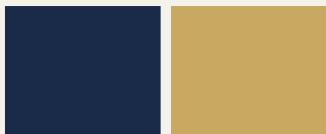
Navy & Oro

Scegli l'atmosfera del tuo brand fra cinque palette curate.